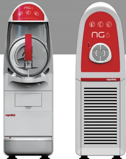
MODELL GRANITOR® NG EASY 6/1