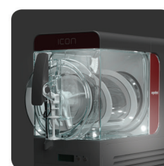
luce frontale - tecnologia LED - (OPT) front light - LED technology - (OPT)