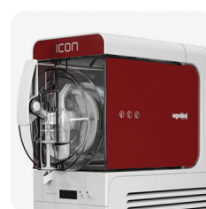
grafiche per versione no visual (OPT) graphics for no visual version (OPT)