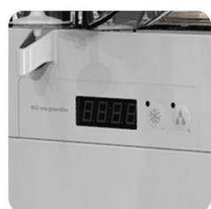
controllo elettronico della temperatura electronic temperature display