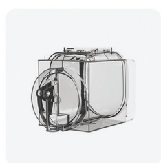
RECOVER anticondensa - sistema brevettato RECOVER anticondensation - patented system