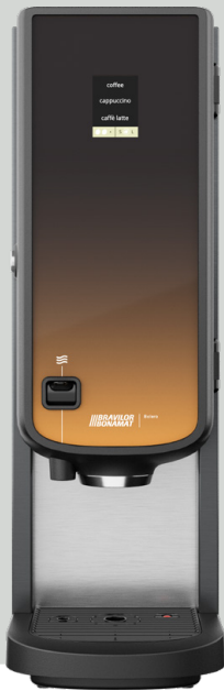
Bolero 21 mit Heißwasserzapfhahn