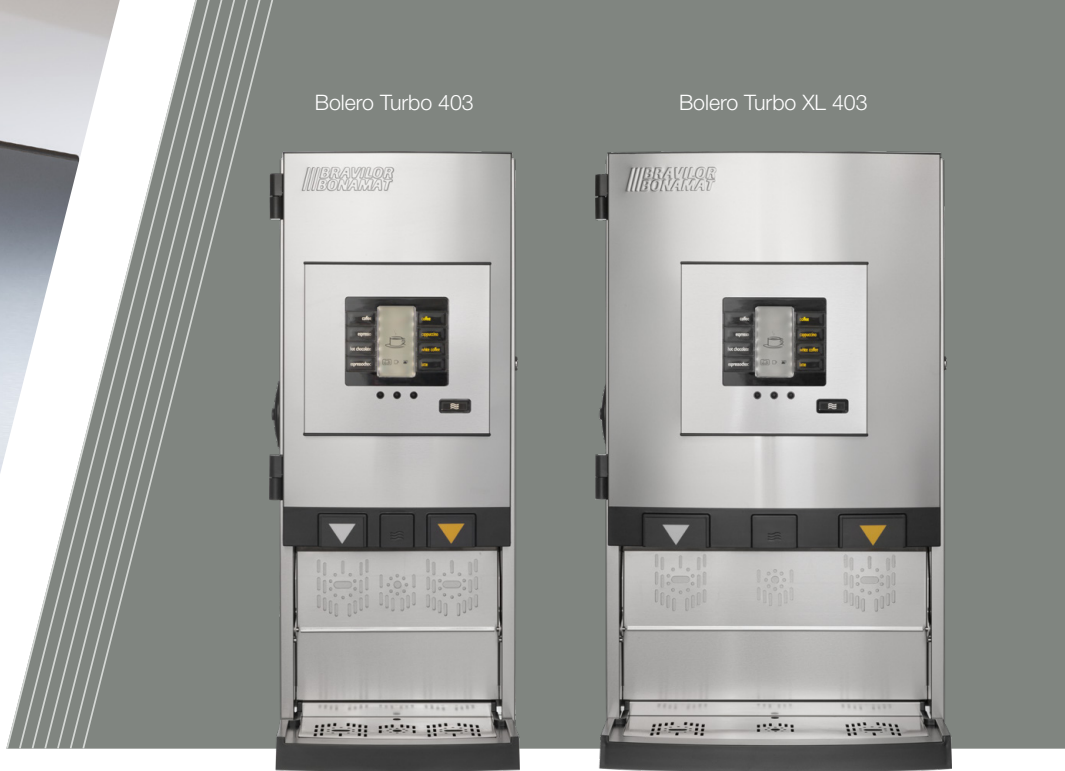
Bolero Turbo XL 403